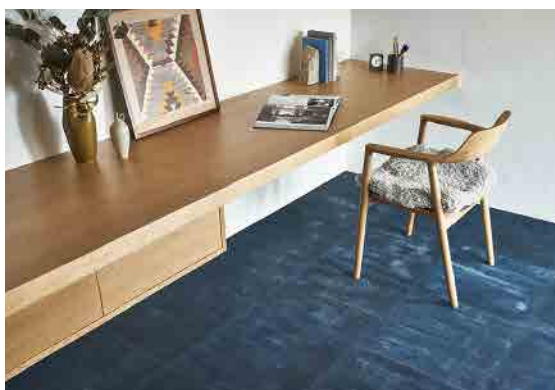
経年変化前・変化後の使用イメージ