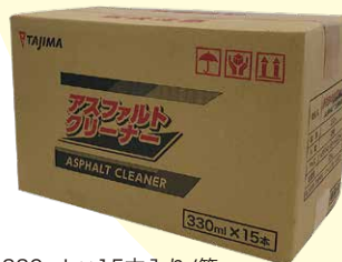
330mL×15本入り/箱 330mL×6本入り/箱