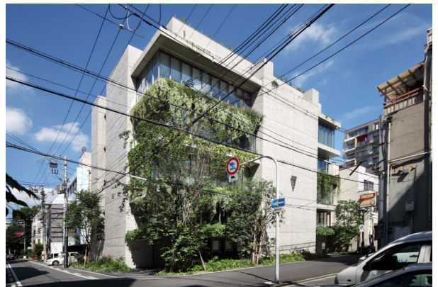
ボタニカルスクリーン全景